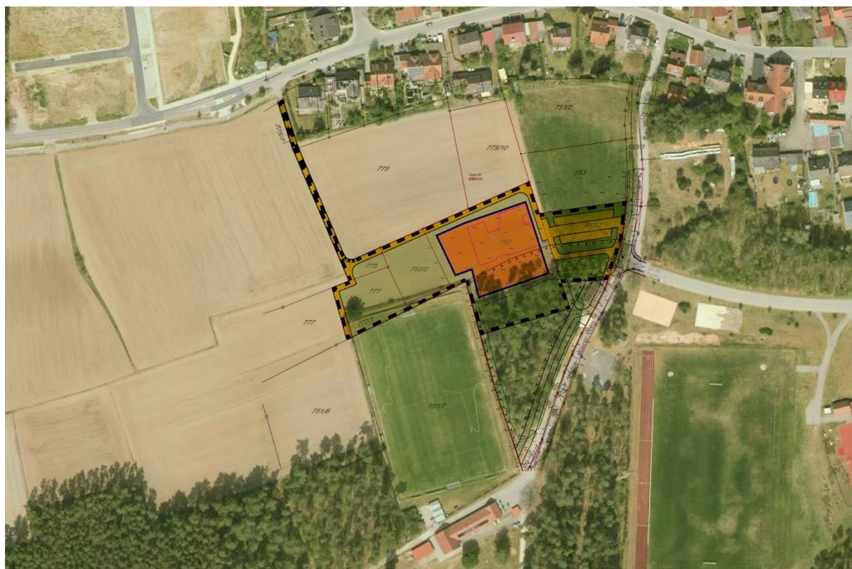
Abb. 1: Überlagerung der Planung (Zagel Architekten, Wendelstein; Stand Februar 2020) mit Luftbild (Bayern-Atlas). Abgrenzung Geltungsbereich: gestrichelte Linie, Baufeld: orangefarbene Fläche, Wege: orangefarbene Linien.

Die im Geltungsbereich vorliegenden Strukturen umfassen im Norden eine Grünlandfläche (Flur 753/7, Abb. 3) und mehrere Äcker (Fluren 752, 752/2, 775, 775/10, 777; Abb. 4 und 9). Der Südteil tangiert ein Wäldchen mit lockerem Altkiefernbestand und dichtem Unterwuchs aus Gehölzsukzession diverser (Laub-)Baumarten (Abb. 3 bis 7). Der Südteil des Wäldchens ist deutlich lichter mit lückigem Unterwuchs (Abb. 8). Im Nordosten, am Ostrand des Wäldchens steht ein gemeindliches Gebäude und nördlich davon, auf Flur 753/7 eine Reihe von fünf alten und zwei jungen Eichen (Abb. 2). Nördlich von diesen Bäumen sind die künftige Zufahrt zur Kita und ein öffentlicher Parkplatz geplant.