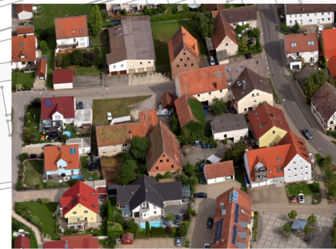
2 Neugestaltung Freifläche Bücherei