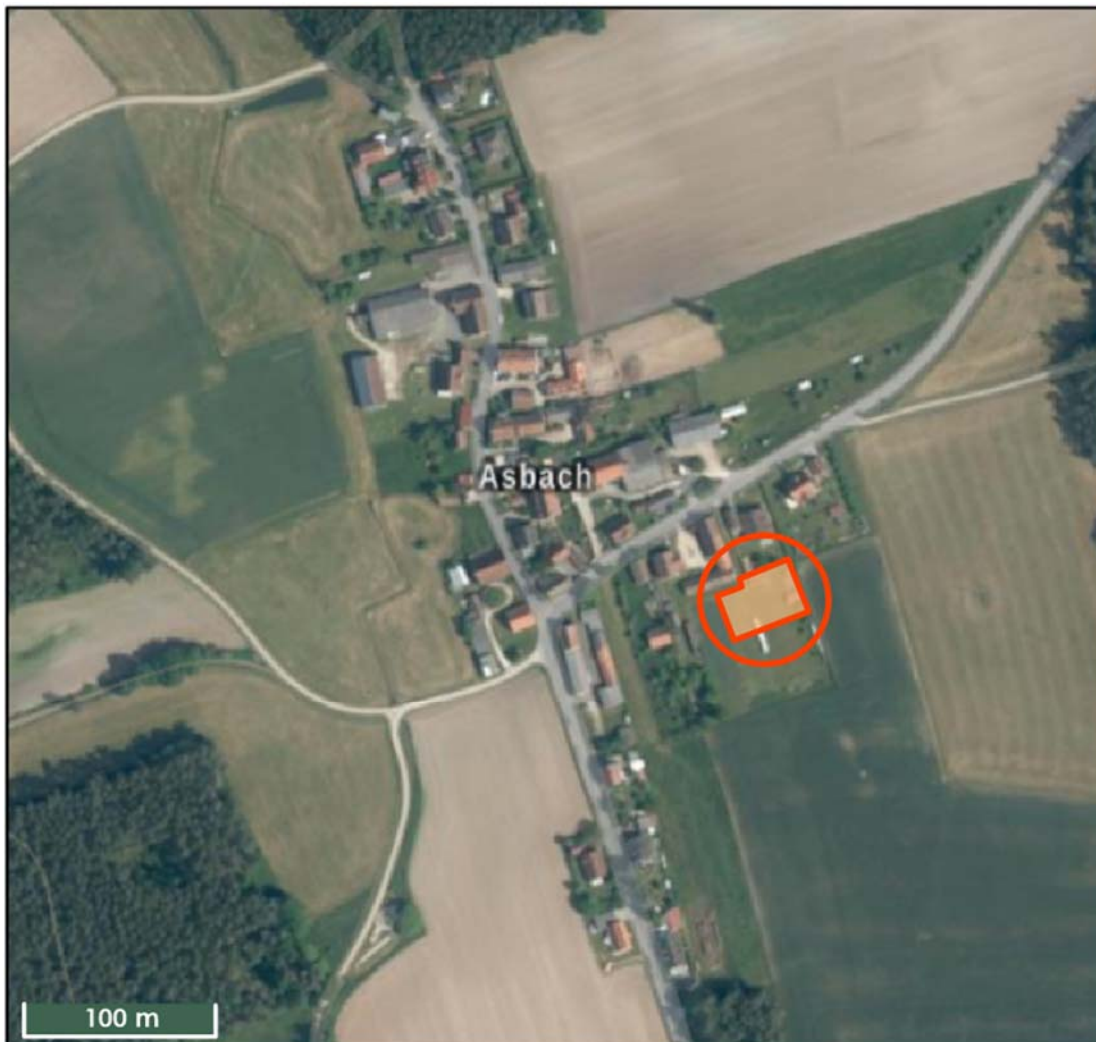
Abb. 1: Satellitenfoto, BayernAtlas, 2024, mit dem Planbereich