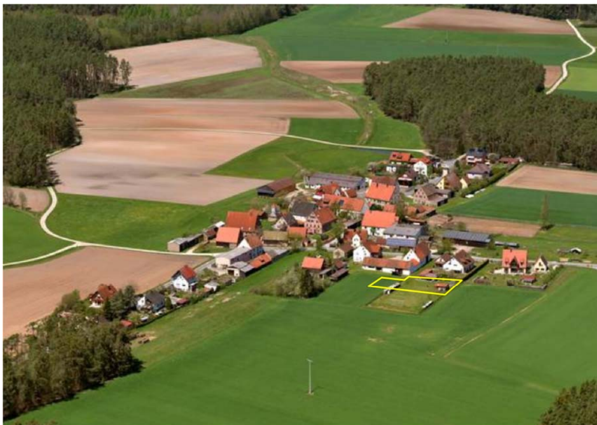
Abb. 4: Ortsteil Asbach, Vogelschau von Südosten, gelb eingefasst die Einbeziehungsfläche

Die Fläche des Grundstücks Fl.-Nr. Tfl. 772/1 u. 774/3 fällt leicht nach Norden ab und wird derzeit als private Grünfläche (Fl.-Nr. 772/1) bzw. als Ackerfläche (774/3) genutzt. Gewässer befinden sich nicht in der Nähe.