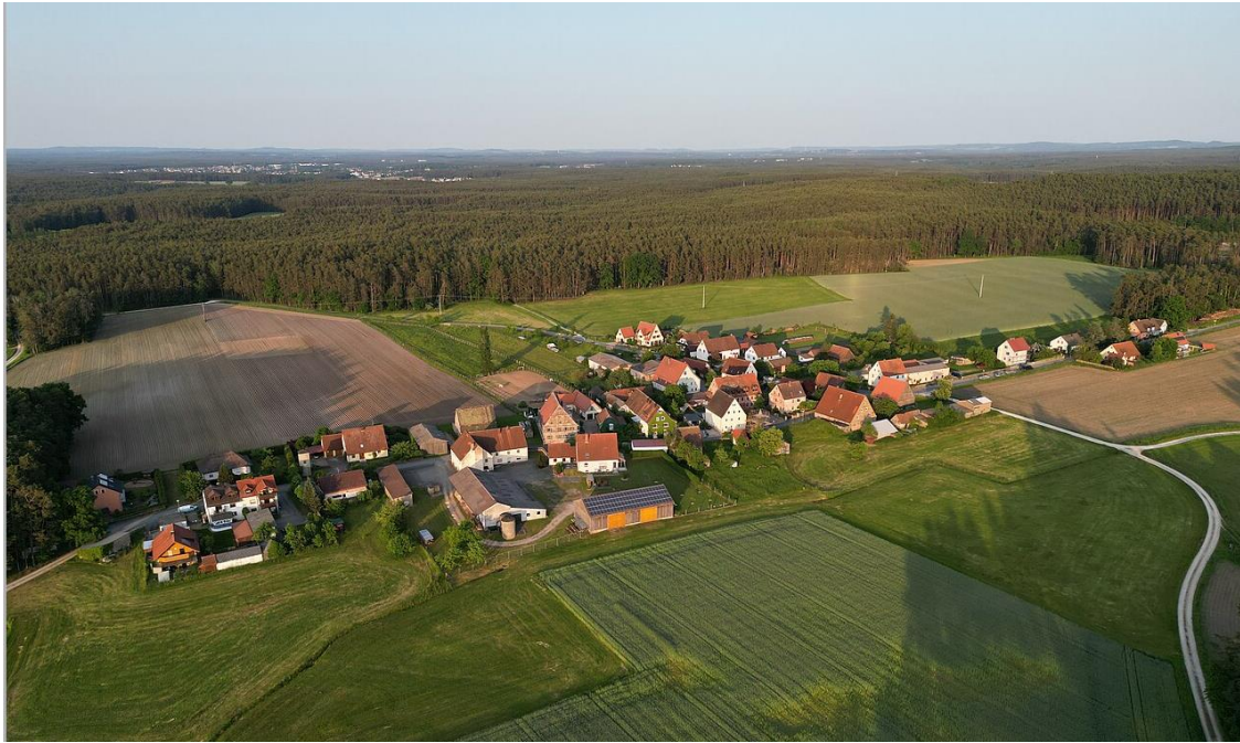
Abs.: 4: Das Dorf Asbach, Luftaufnahme von Nordwesten