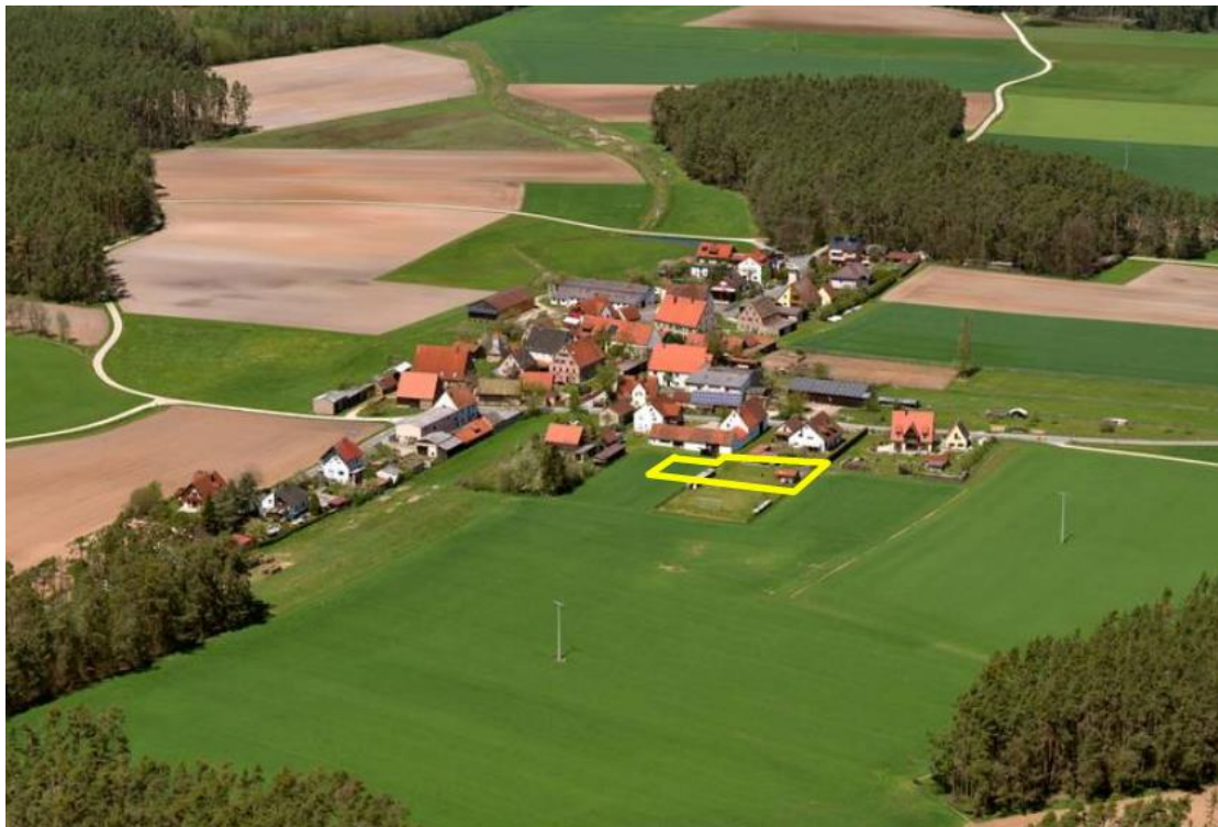
Abs.: 3: Das Dorf Asbach, Luftaufnahme von Südosten

Bzgl. Beeinträchtigung hinsichtlich Freizeit und Erholung sind zwar keine Wander- oder Radwege in unmittelbarer Nähe vorhanden, die Straßen und Wege in diesem Bereich sind aber allgemein für die Bezüge zwischen Dorf und Landschaft und die siedlungsnahe Erholung wichtig.