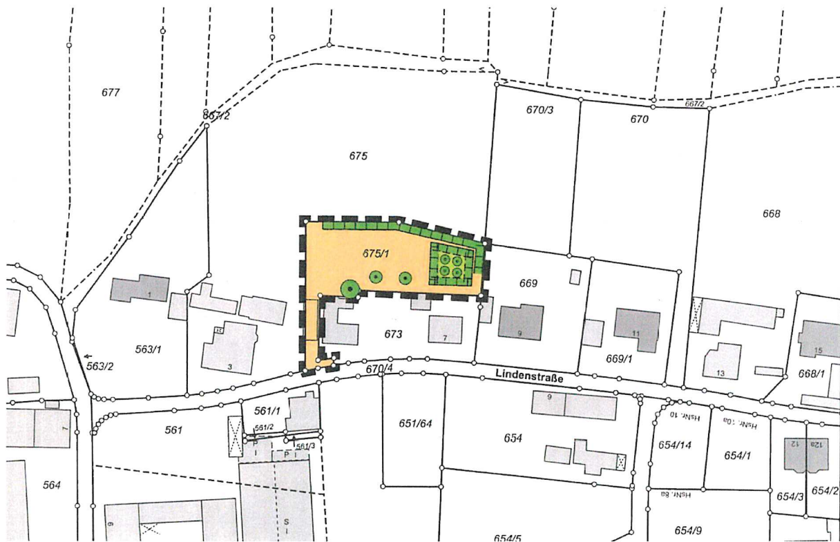
Planblatt mit Lageplan

Der Gemeinderat von Büchenbach hat in der öffentlichen Sitzung vom 7. April 2020 die Einbeziehungssatzung „Lindenstraße-Nord“ für den Ortsteil Götzenreuth, Gemeinde Büchenbach, gemäß § 34 Abs. 4 Satz 1 Nr. 3 Baugesetzbuch (BauGB) als Satzung beschlossen.